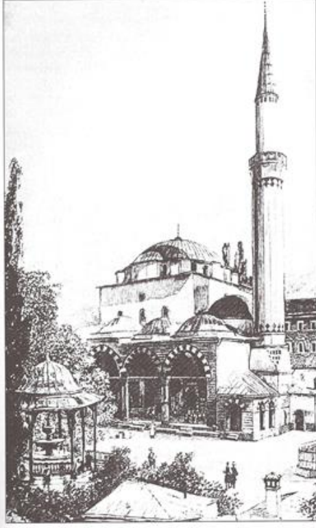
GAZİ HÜSREV BEY CAMİİ